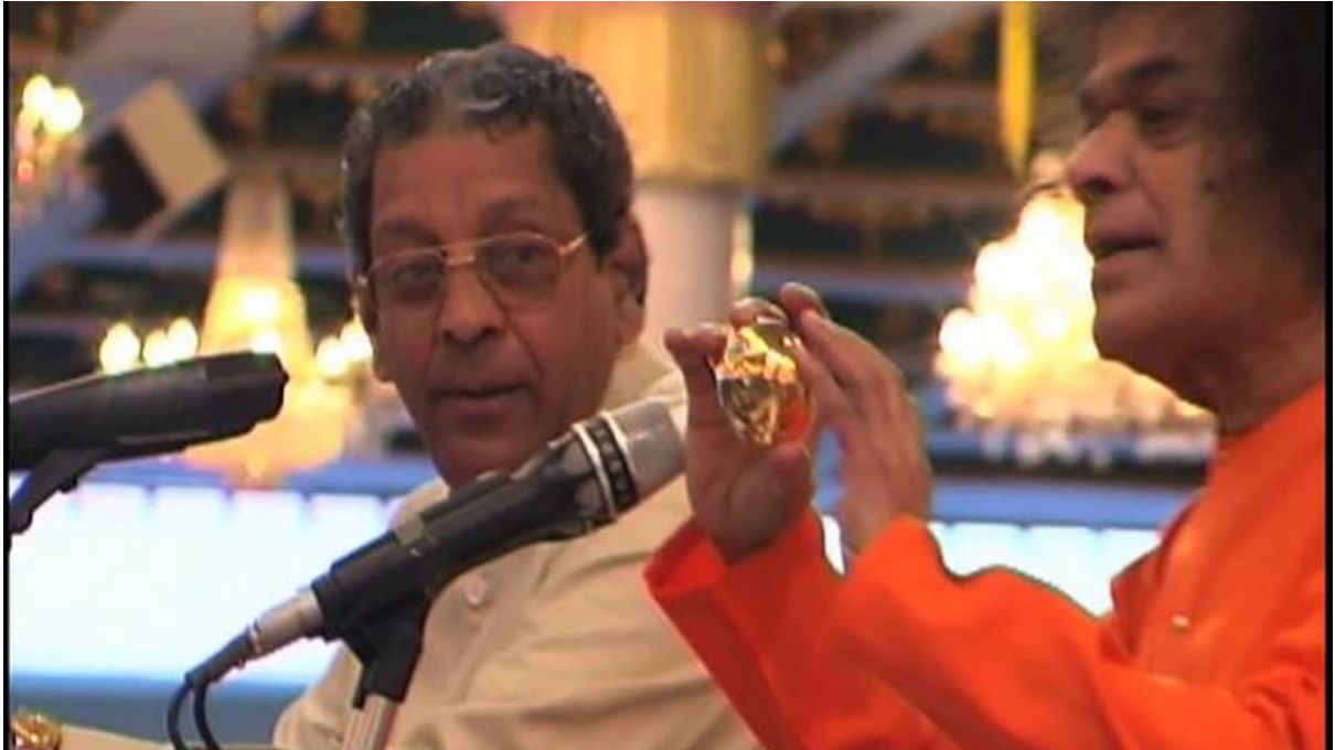
2002 Shivarathri: Hiranyagarbha Linga created by Swami

ആദ്യമായി, ഞാൻ നിങ്ങളോട് പറയട്ടെ: സ്വയലഭേദം(Gross body)- ശരീരം, ഇന്ദ്രിയങ്ങൾ(senses), ആന്തര ഇന്ദ്രിയങ്ങൾ(inner senses) ഈ ഇന്ദ്രിയങ്ങളെയെല്ലാമാണ് സ്വയലഭേദം അഥവാ gross body എന്ന് വിളിക്കുന്നത്. പിന്നെ മനസ്സുണ്ട്, അത് ആന്തരമാണ്, ആന്തര ഇന്ദ്രിയങ്ങൾ(inner senses):