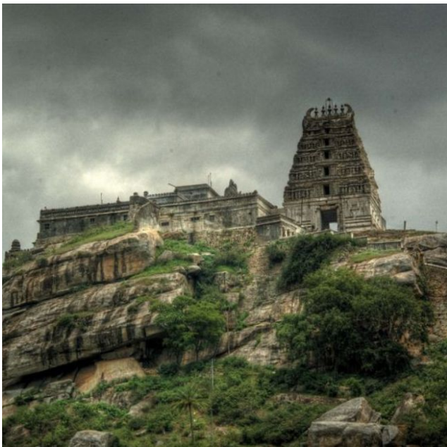
ഘടികാചലം നരസിംഹസ്വാമി ക്ഷേത്രം(തമിഴ്നാട്)