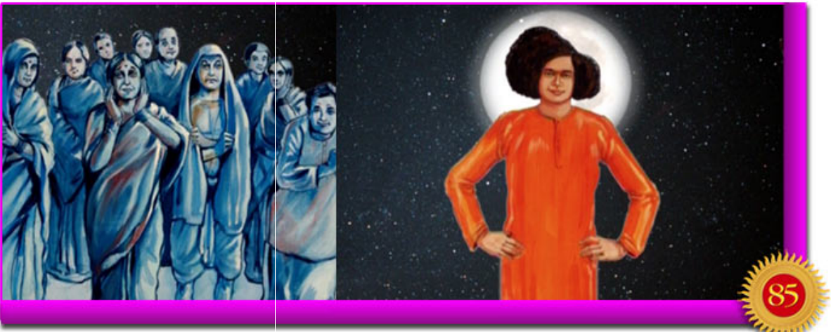
ചിത്രാവതീ നദീതീരത്തെ ചാന്ദ്രദർശനം

പറയപ്പെട്ടതൊക്കെ സംഗ്രഹീതമായി ഇവിടെ നിങ്ങളുമായി പങ്കു വയ്ക്കുന്നതിന് എനിക്ക് സന്തോഷമാണ്. ഭഗവാൻ അവിടുന്നിന് പുറകിലായി സൂര്യനെ കാട്ടിക്കൊടുക്കുക; ഭഗവാൻ അവിടുത്തെ ശിരസ്സിനു പുറകിലായി ചന്ദ്രനെ കാട്ടിക്കൊടുക്കുക; ഭഗവാൻ അവിടുത്തെ ചിത്രാവതീ നദീതീരത്തേക്ക് അനുഗമിച്ചവർക്ക് മുകളുണ്ണു കാട്ടിക്കൊടുക്കുക! ശരിക്കും എത്ര അതിശയകരങ്ങളായ അനുഭവങ്ങളാണവ!