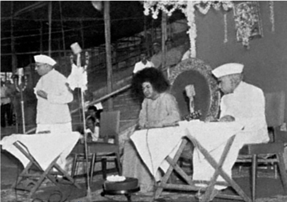
ഡോ.രാമകൃഷ്ണറാവു സ്വാമിക്കൊപ്പം വേദിയിൽ

ദ്ദേഹം. അദ്ദേഹം പല സംസ്ഥാനങ്ങളിലും ഗവർണറായിരുന്നു. അദ്ദേഹം ഹൈദരാബാദ് സംസ്ഥാനത്ത് മുഖ്യമന്ത്രിയായും സേവനം അനുഷ്ഠിച്ചിരുന്നു. അദ്ദേഹം പല സ്ഥാനങ്ങളും അലങ്കരിച്ചിരുന്ന ആളാണ്; സ്വാമിയോട് വളരെ അടുപ്പമുള്ള വ്യക്തിയാണ് ഡോ.