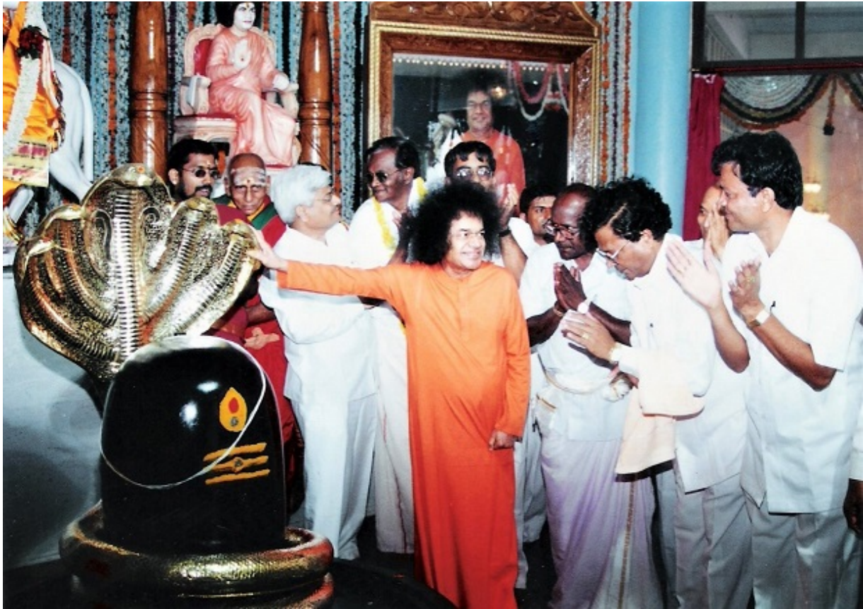
നന്ദനവനം ശിവക്ഷേത്രം ചക്കൂർ: സ്വാമി അഭിഷേകം നിർവഹിച്ചത്

അത്താഴസമയത്ത്, സംഭവിച്ചതെന്താണെന്ന് ഞാൻ നിങ്ങളോട് പങ്കുവയ്ക്കാൻ ആഗ്രഹിക്കുകയാണ്. ജാവേദ് സഹോദരന്മാരുടെ മാതാപിതാക്കളോട് മുൻഭാഗത്തായി, ഭഗവാൻ