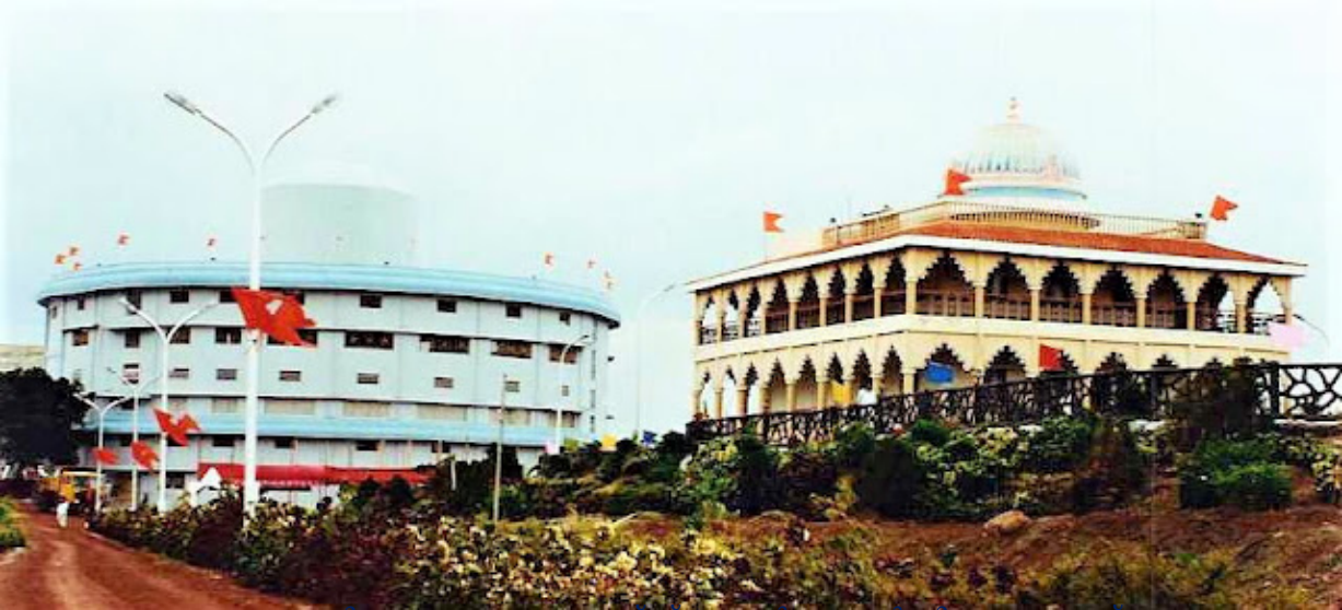
സത്യസായി നന്ദനവനം കോംപ്ലക്സ്, ചക്കൂർ, ലത്തൂർ ജില്ല, മഹാരാഷ്ട്ര