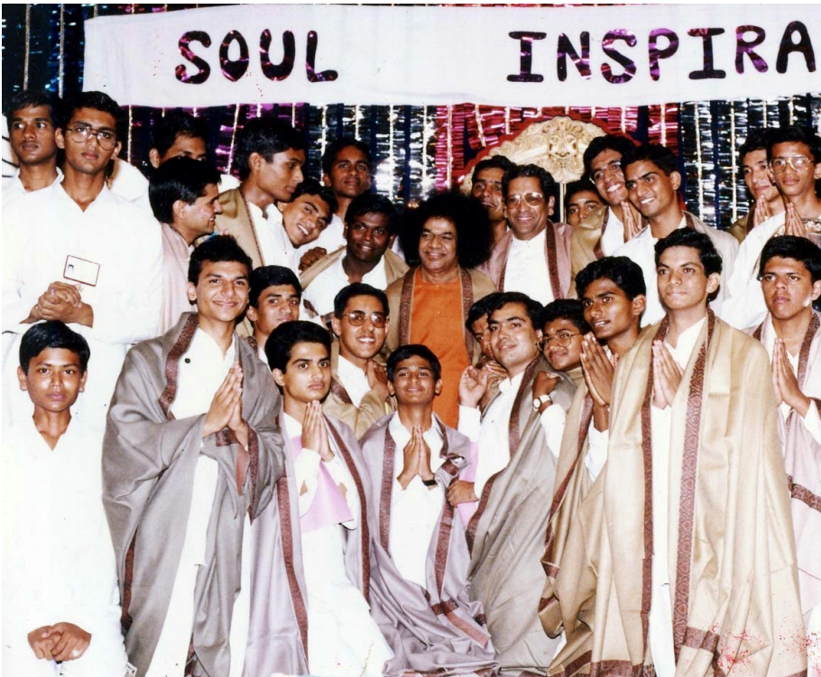
നവരാത്രി കവിസമ്മേളനം 1993 ഒക്ടോ.23

എന്നു തോന്നും!” കസ്തുരി ചിരിച്ചിട്ട് പറഞ്ഞു, “സ്വാമി, അത് ബോൻഡേജ് അല്ല! അതെന്ന ജനനമരണ ബന്ധനത്തിൽനിന്ന്, ബോൻഡേജി(bondage)ൽനിന്ന് മുക്തനാക്കും!”