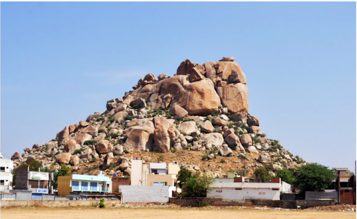
ഉറവക്കൊണ്ട: പശ്ചാത്തലത്തിൽ കാണുന്നത് സർപ്പമല(Serpent Hill)

കുട്ടികൾ ഈ ആശയം ഉൾക്കൊണ്ടു. നാടകത്തിൽ, ഇപ്പോൾ സ്വർഗ്ഗനിവാസികളായ ഈ അധ്യാപകരെല്ലാവരും സത്യസായി ബാബയെ തേടി ഭൂമിയിലേക്ക് ഇറങ്ങിവരികയാണ്. അവരിവിടെ വസിച്ചത് എഴുപത് കൊല്ലങ്ങൾക്കു മുമ്പാണ്, സ്വാമിക്ക് അഞ്ചോ ആറോ വയസ്സുള്ളപ്പോൾ. ആ പുട്ടപർത്തി ഇന്നത്തെ പുട്ടപർത്തിയിൽനിന്ന് തീർത്തും വ്യത്യസ്തമാണ്. അതുകൊണ്ട് സ്വർഗ്ഗത്തുനിന്നും ഇറങ്ങിവന്ന ആ അധ്യാപകർക്ക് വഴി തെറ്റുന്നു. എവിടെ പോവണമെന്ന് അവർക്കറിയില്ല.