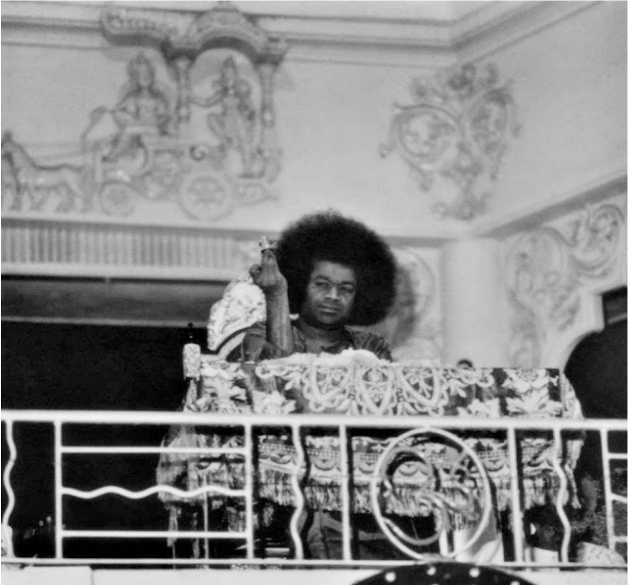
ഭഗവാൻ ലിംഗോത്ഭവത്തിനു ശേഷം ശിവലിംഗവുമായി

നാരദർ പറഞ്ഞു, “അല്ലയോ ഇന്ദ്രാ, പരിഭ്രമിക്കേണ്ട. നാം ഇരുവരും മഹാവിഷ്ണുവിന്റെ അടുത്തുചെന്ന് എന്തെങ്കിലും പരിഹാരത്തിനായി, കാണാതായവരുടെ വിലാസത്തിനായി, നഷ്ടമായ സാധനങ്ങൾ വീണ്ടെടുക്കുന്നതിനായി, പ്രാർത്ഥിക്കാം.”