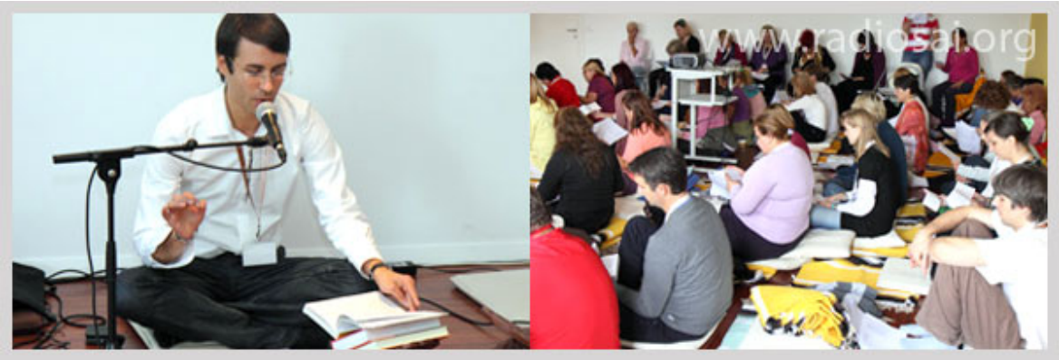
സ്റ്റോവേനിയയിൽ രൂദ്രം ശില്പശാല-വാജ്കോ 2 ഒക്ടോബർ 2010

“സ്വാമി അകത്തും പുറത്തുമുള്ളപ്പോൾ, സ്വാമി എല്ലായിടത്തുമുള്ളപ്പോൾ, താങ്കളുടെ ചോദ്യത്തിന് പ്രസക്തിയില്ല, എന്തുകൊണ്ടെന്നാൽ അവിടുന്ന് എല്ലായിടത്തുമുണ്ട്. അത് യുദ്ധകാലമായിരുന്നു, ഞങ്ങൾക്ക് ഞങ്ങളുടെ കുടുംബത്തെ മാറ്റേണ്ടിയിരുന്നു. സ്വാമി ഞങ്ങളുടെ കുടുംബത്തിലെ എല്ലാവരെയും രക്ഷിച്ചു. ഞങ്ങൾ അവിടുത്തോട് വളരെ നന്ദിയുള്ളവരാണ്; ഞങ്ങൾ അവിടുത്തോട് വളരെ കടപ്പെട്ടവരാണ്. ഇന്ന് ഞങ്ങൾ സുരക്ഷിതരും ആപത്തില്ലാത്തവരും ആണെങ്കിൽ, അത് ഭഗവാന്റെ കൃപകൊണ്ടാണ്, കാരണം യുദ്ധത്തിനിടയ്ക്ക് ഞങ്ങൾക്ക് വീടുകളിൽനിന്ന് പലായനം ചെയ്യേണ്ടിവന്നിരുന്നു. ആ വെല്ലുവിളി നിറഞ്ഞ, പരീക്ഷണ നിമിഷങ്ങളിൽ, സ്വാമി ഞങ്ങളുടെ രക്ഷയ്ക്കെത്തി. സ്വാമി എനിക്ക് വഴികാട്ടുന്നു എന്നാണ് എനിക്ക് വ്യക്തിപരമായി തോന്നിയിട്ടുള്ളത്. ഓരോ ദിവസവും അവിടുന്ന് എന്നെ നയിക്കുന്നു. അതാണെന്റെ തോന്നൽ.”