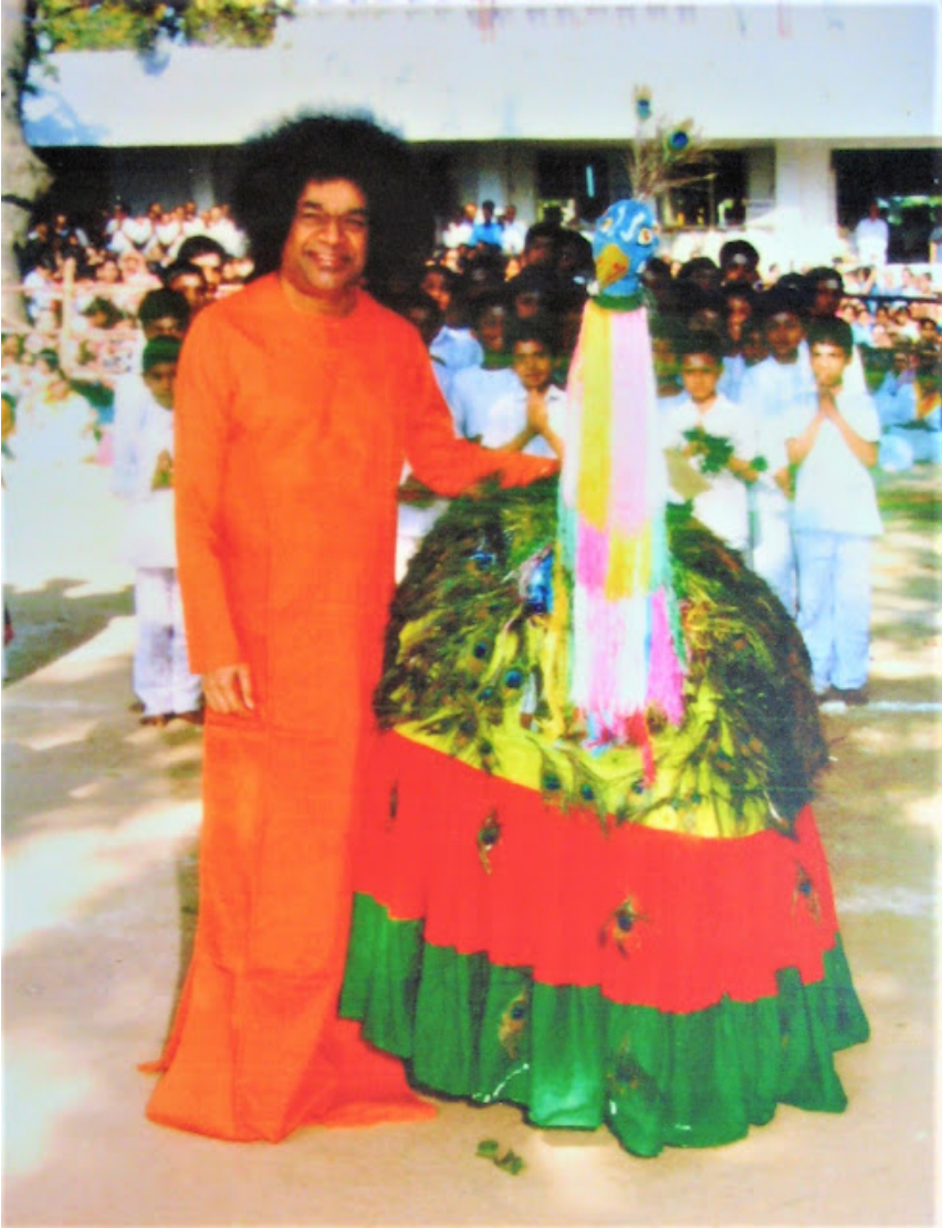
ഭഗവാൻ ബാലവികാസ് റാലിയിൽ

ഭഗവാൻ ആ ടീച്ചർമാരോട് ഇതും അരുളുകയുണ്ടായി, “മൂന്നു ദിവസമായി നിങ്ങൾ മാനവമൂല്യവിദ്യാഭ്യാസത്തെക്കുറിച്ചുള്ള സെമിനാറിൽ പങ്കെടുക്കുകയായിരുന്നു. ഈ മൂല്യങ്ങൾ മറ്റെവിടെനിന്നെങ്കിലും നിങ്ങൾ ആവാഹിക്കുന്നതാണെന്ന് കരുതുന്നുണ്ടോ? മാനവമൂല്യങ്ങൾ എവിടെയാണ്? നിങ്ങൾ അവ പഠിക്കുന്നതാണോ? നിങ്ങൾ മനുഷ്യജീവിയാണ്, ശരിതന്നെ! അതുകൊണ്ട്, നിങ്ങൾ മാനവമൂല്യങ്ങളുമായാണ് ജനിച്ചിട്ടുള്ളത്. ഒരു വൃക്ഷം വൃക്ഷത്തിന്റെ ഗുണങ്ങൾ ആർജ്ജിക്കുന്നതല്ല. ഒരു മൃഗം മൃഗത്തിന്റെ ഗുണങ്ങൾ ആർജ്ജിക്കുകയല്ല. ഇതുപോലെ, ഒരു മനുഷ്യജീവിയും മാനവമൂല്യങ്ങൾ പഠിക്കേണ്ട ആവശ്യമില്ല, എന്തുകൊണ്ടെന്നാൽ, അവൻ അവയുമായാണ് ജനിച്ചിട്ടുള്ളതുതന്നെ.”