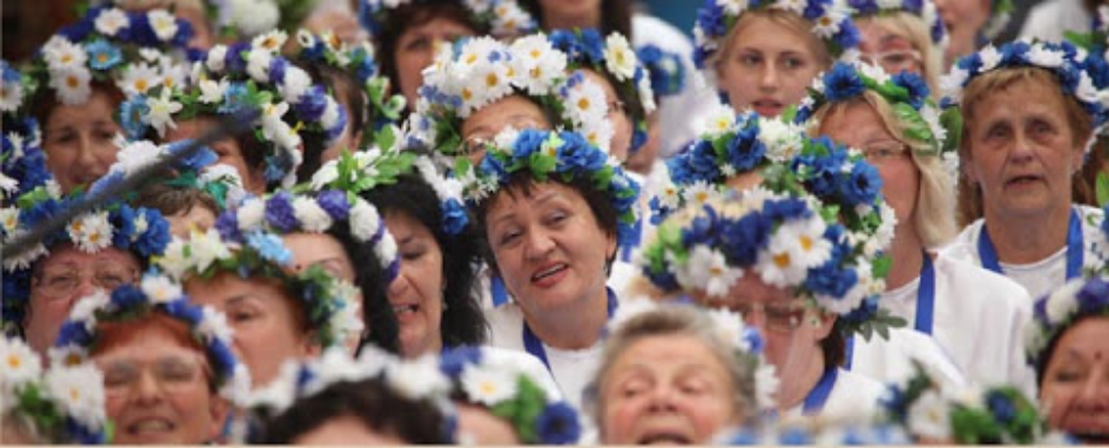
Russian Expression of Love for Divine

ഇതിനിടയിൽ, സ്വാമി അവിടുത്തെ ദൃഷ്ടി ഭക്തരുടെ നേരെ പതിപ്പിച്ചു. എന്നിട്ടവിടുന്ന് തിരികെ ഞങ്ങളെത്തന്നെ നോക്കിയിട്ട് പറഞ്ഞു, “നോക്കൂ! റഷ്യയിൽനിന്നും എഴുപത്തിയൊന്ന് ഭക്തർ ഇവിടെ എത്തിയിട്ടുണ്ട്. ഇവിടീരുന്നുകൊണ്ട് അവരെ ശ്രദ്ധിക്കൂ. അവരെ പ്ലാവരും തികഞ്ഞ ഏകാഗ്രതയോടെ അവിടീരുന്ന് സ്വാമിയെപ്പറ്റി മാത്രം ചിന്തിക്കുകയാണ്. നിങ്ങൾ അവരെ ശ്രദ്ധിച്ചോളൂ! കുട്ടികളേ, നിങ്ങൾക്കറിയില്ല. ഇന്ന് റഷ്യയിൽ നിരവധി ഭക്തരുണ്ട്. അവരിൽ മിക്കവരുടെയും വീടുകളിൽ അഥവാ ഓഫീസുകളിൽ ബാബയുടെ ഫോട്ടോയുണ്ട്.”