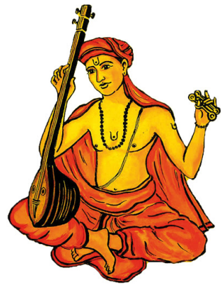
St. Thyagaraja (1767 – 1847)

കടന്നുപോകുന്ന ആനയെ നോക്കി നായ്ക്കൾ കുരച്ചേക്കാം, പക്ഷേ ആനയ്ക്ക് ഒന്നും നഷ്ടപ്പെടാനില്ല. സമുദ്രത്തിന്റെ അപാരത നിങ്ങൾക്കറിയാം. അമൃതവും ഹാലാഹലവും(വിഷം) ഒരേ സമുദ്രത്തിൽനിന്നാണ് ഉണ്ടാവുന്നതെന്ന് പുരാണങ്ങൾ ഉത്ഘോഷിക്കുന്നത് നിങ്ങൾ കേട്ടിട്ടില്ലേ? അമൃതം നിങ്ങൾക്ക് സന്തോഷം നൽകുന്നു, എന്നാൽ വിഷം അപകടകരവും. അങ്ങനെയല്ലേ?