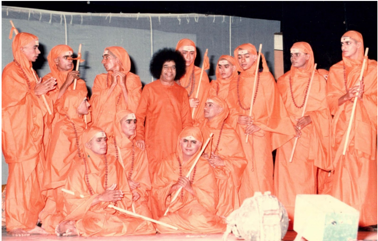
ഭഗവാൻ ഭജഗോവിന്ദം നാടകത്തിനു ശേഷം വിദ്യാർത്ഥികളുമൊത്ത്(1987)

ആർക്കറിയാം? ആ മുതലയ്ക്കും ശങ്കരനും ഇടയിൽ ഏതോ ഒരു തരം സൗഹൃദം ഉണ്ടായിരുന്നിരിക്കണം! ഒരു പൂർവജന്മത്തിൽനിന്നുള്ള ഏതോ ബന്ധം അവിടെ യുണ്ടായിരിക്കണം എന്തെന്നാൽ, മുതല ശങ്കരന്റെ കാലിലെ പിടി വിട്ടു. അവൻ അതിജീവിച്ചു, അവനൊരു സന്യാസിയായിത്തീർന്നു.