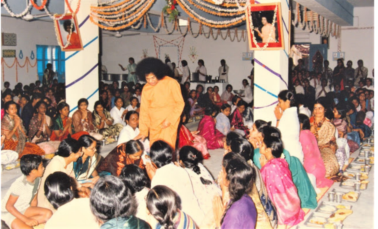
ഭഗവാൻ അനന്തപൂർ കോളജ് ഹോസ്റ്റലിൽ

അതുകൊണ്ട്, സ്ത്രീകൾക്കാണ് കൂടുതലായി വിശ്വാസം എന്ന് സ്വാമി അരുളിയിരിക്കുന്നു. അവർക്ക് പുരുഷന്മാരെ അപേക്ഷിച്ച് പ്രതീക്ഷ കൂടുതലാണ്. തമാശയായി സ്വാമി പറയുകയുണ്ടായി, “ആൺകുട്ടികളേ, നിങ്ങൾക്കറിയാമോ, ഞാൻ 13 കൊല്ല