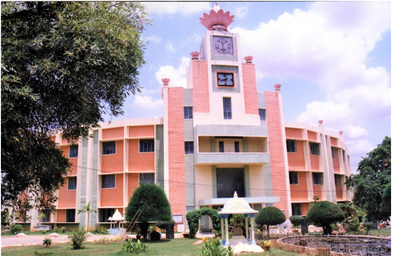
അനന്തപുർ ഗേൾസ് കോളജ്

അതുകൊണ്ട്, നാം മനസ്സിലോർക്കേണ്ടത് ഈ സ്ത്രീപുരുഷ വർഗീകരണം ലിംഗ ഭേദത്തെ അടിസ്ഥാനമാക്കിയല്ല എന്നതാണ്. സ്വാഭാവികമായും നാം സ്ത്രീസഹജമായ ഗുണങ്ങളെ പരിഗണിക്കുമ്പോൾ, അതവരെ അനായാസം ശിഷ്യരാക്കുന്നു. ഒരു സ്ത്രീയെ സംബന്ധിച്ച്, ഒരു ശിഷ്യയാവുന്നത് എളുപ്പമാണ്. അതുകൊണ്ട്, ഈ ഗുണങ്ങൾ, സ്ത്രൈണഗുണങ്ങളും പുരുഷഗുണങ്ങളും ഒരുമിച്ചുചേർന്ന് ഒരൊറ്റ ജീവൈക്യമായിത്തീരുന്നു. അപ്പോൾ ലയം പൂർണ്ണമാവുന്നു. രണ്ട് ശരീരങ്ങളും ഒരു